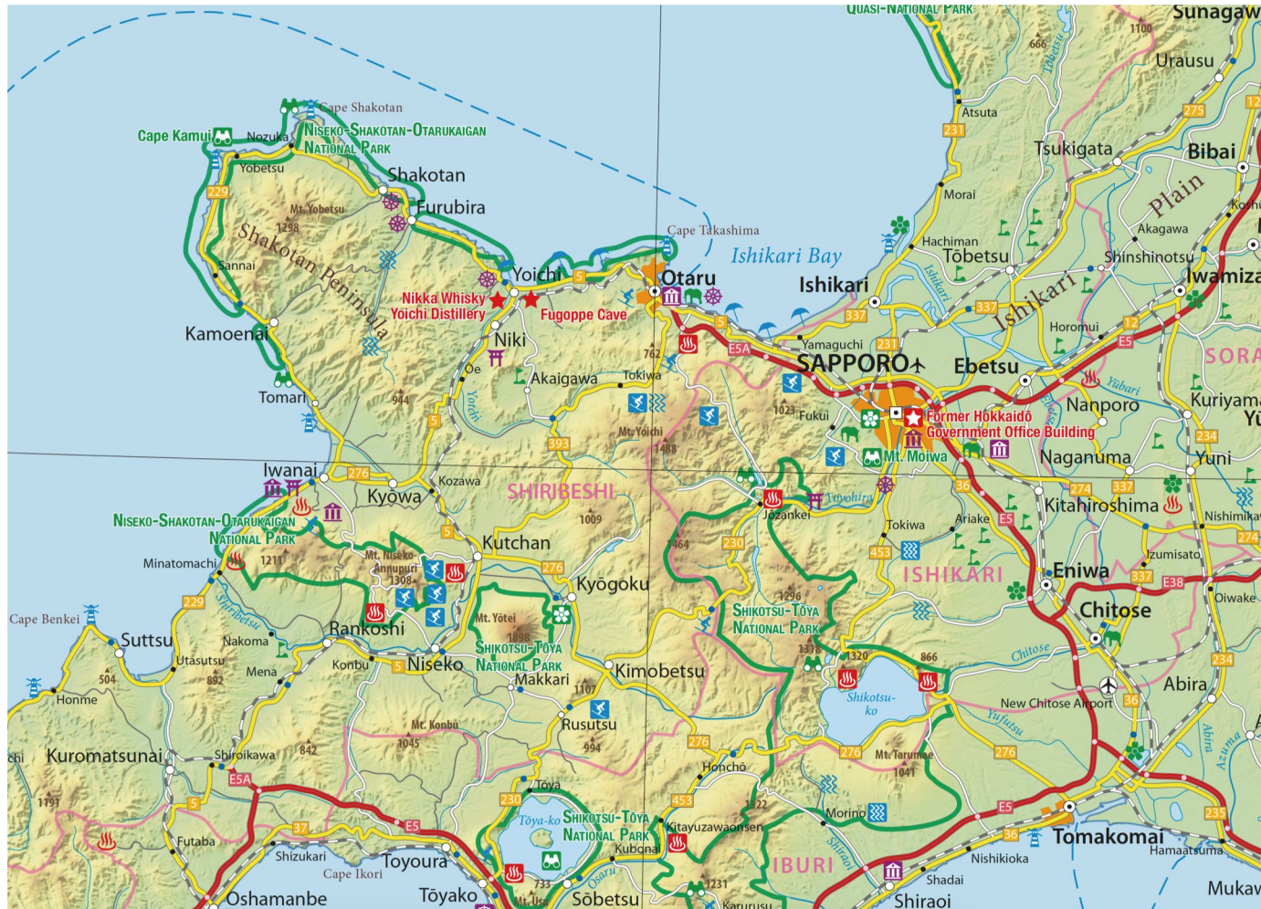
Abb. 5: Ausschnitt aus der fertigen Karte