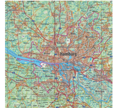
Abb. 1: Gebrauchskarte (SIEMS 2018)