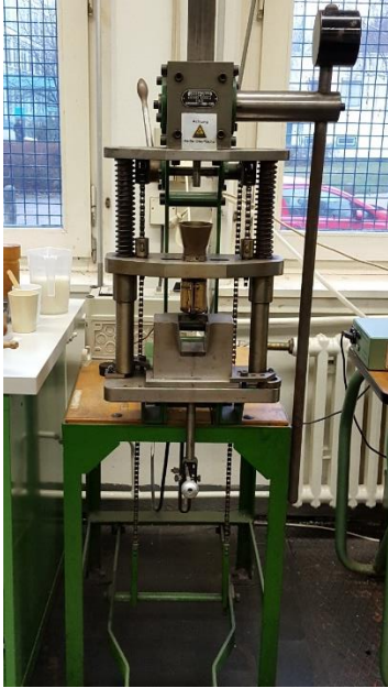
Plastikon Typ BZ5 Kolbenspritzgießmaschine Nachbau