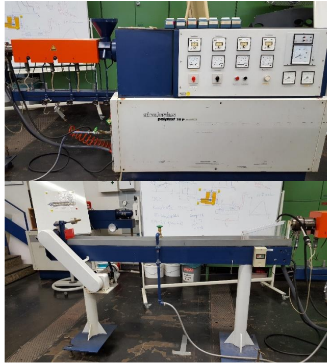
Laborextruder Schwabenthan Polytest 30P