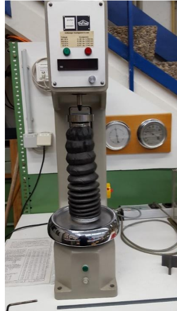
Frank 38367 Härteprüfung, Bestimmung der Kugel durch Härte von Kunststoffen