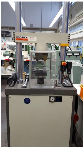
Schenck Hydropols PSA Servohydraulische Universal-Axialprüfmaschine