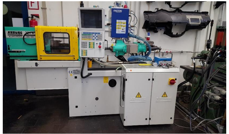
Arburg Allrounder Spritzgießmaschine 221 K 350-100