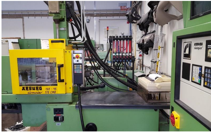
Arburg Allrounder Spritzgießmaschine 170CMD 150- 45