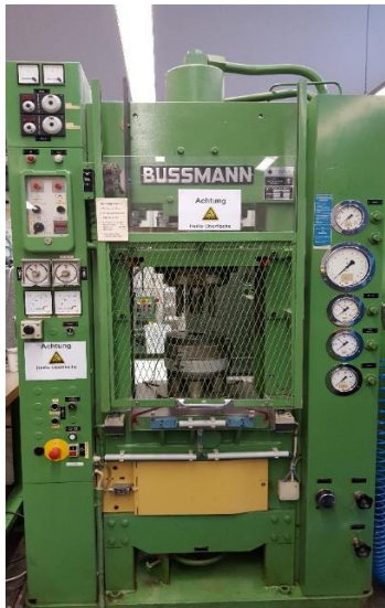
Hydraulische Bussmann Presse HPK 60/6